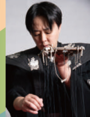
十三代目 結城孫三郎