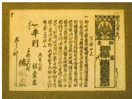
江戸時代の公演のチラシ