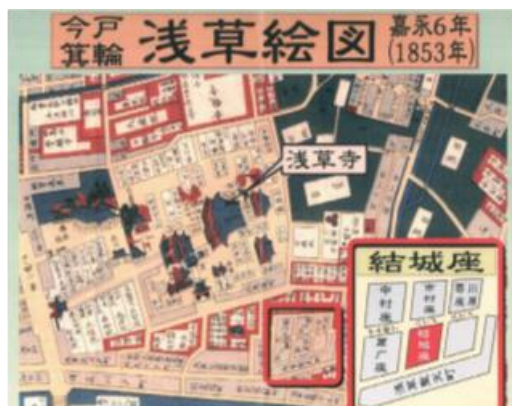
浅草移転後の結城座の所在を示す地図

「伝統と革新、古典と新作の両輪」を活動指針に掲げ、近年では、特に海外公演や、現代演劇とのコラボレーションによる国際共同制作にも積極的に取り組んでおり、江戸系あやつり人形の技芸、表現力を追求し、その成果の普及に努めている。新作においては、役者と人形の共演、人形遣いが人形を遣う一方、生身で役者を演じたり、劇中に古典の手法や写し絵等を挿入するなど、独特の舞台空間を創造し続けている。アヴィニヨン演劇祭・ザグレブ・スポレート等、数々の世界有数の国際演劇祭に招聘された実績をもつ。また、2004年より人形遣い育成事業を様々なかたちで展開。2020年からプロ志向の表現者に向けた「人形と俳優のクロスオーバー」を開始。