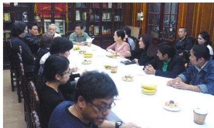
3 月 25 日ベトナム青年劇場ミーティング室にて