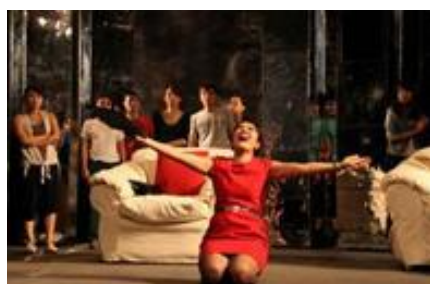
現代劇団Ⅱ 『おしん（家政婦）の家』 演出：レー・カイン (Le Khanh) 初演：2012年

1978年に設立された国立劇場・劇団のひとつ。2013年11月現在、現代劇を扱う現代劇団Ⅰ、現代劇団Ⅱ、歌と踊りのパフォーマンスを行う歌舞劇団、フィジカルシアター（ベトナムで唯一）の4劇団を擁する。団員数は、事務スタッフ、技術スタッフを含めて約200名。児童劇からミュージカルまで幅広いレパートリーをもち、一年間で、約10のプログラムを青年劇場内で350回以上、地方巡回で250回以上、上演。年間観客数は、地方巡回も含めて45万人以上を動員しており、ベトナムで最も活発に上演している劇団のひとつである。2010年には、第1回国際イプセン演劇祭（主催：特定非営利活動法人舞台21/於：あうるすぽっと）の招待を受け、現代劇団Ⅱが訪日。2006年に初演した『人形の家』を再演している。なお、青年劇場の劇場は、3階席まであり、客席数は618席。