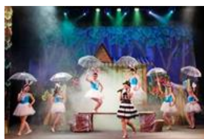
歌舞劇団 『子ども天国』 演出：レー・フン (Le Hung) 初演：2012年