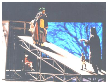
日仏国際共同制作「屏風」より