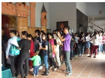
国立 ベトナム人形劇場前

ベトナムの皆様の日本文化への強い関心は、私共の予想以上のものでハノイにある定員 300 名のベトナム人形劇場は、連日 450 名というあふれんばかりのお客様で満杯となりました。放送局の取材も 10 社近くに及び関心の深さが伺えました。