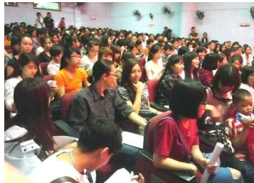
国立 ベトナム人形劇場内